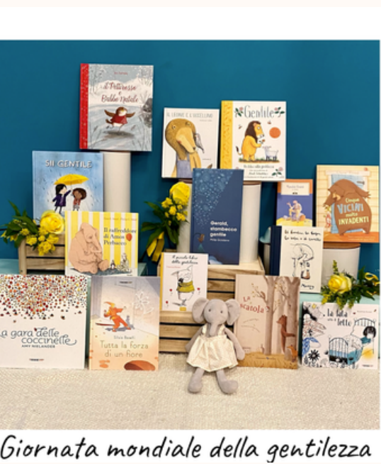
Giornata mondiale della gentilezza

Leggere ad alta voce ai bambini e alle bambine, già dalla primissima infanzia, apporta numerosi benefici tra cui un importante incremento dello sviluppo del linguaggio, aumenta il livello di attenzione, migliora la memoria e sviluppa l'interesse verso i libri e la condivisione. Per festeggiare la Giornata Mondiale della Gentilezza, abbiamo pensato al primo progetto dedicato all'ASCOLTO: "IL BAULE DELLE STORIE".